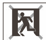
誘導灯 非常用照明器具