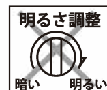
調光機能付器具 (100%点灯でも使用不可)