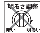
調光機能付器具 (100%点灯でも使用不可)