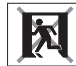
誘導灯 非常用照明器具