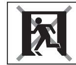
誘導灯 非常用照明器具