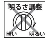
調光機能付器具 (100%点灯でも使用不可)